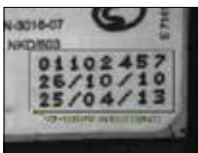
LOT Code Inspection