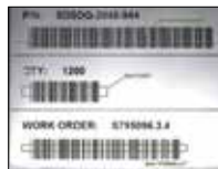
1D Code Reading