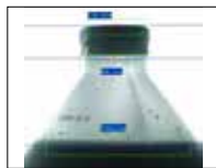
Fill Level Inspection