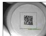
2D Code Reading