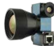
Infrarotkameras & Mikrobolometer