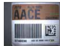
Color Label Inspection